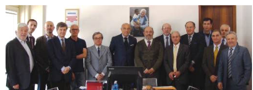
Amministratori e membri del Collegio Sindacale, con il Presidente ed il Direttore Generale del nostro Confidi